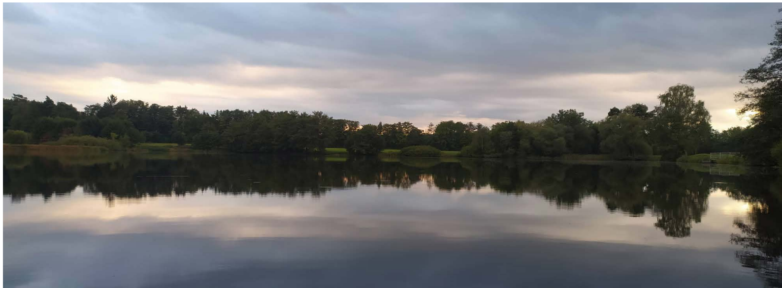
Pozdní léto u Dvorského rybníka, foto: Mgr. Pavel Žižka