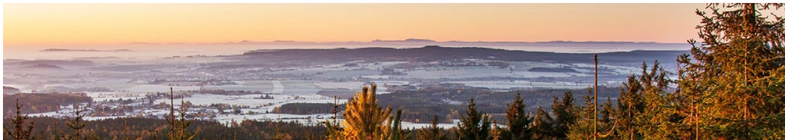
Mrazivé ráno na Malém Toku