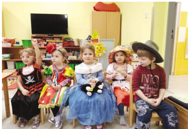
Masopust - Sluníčka