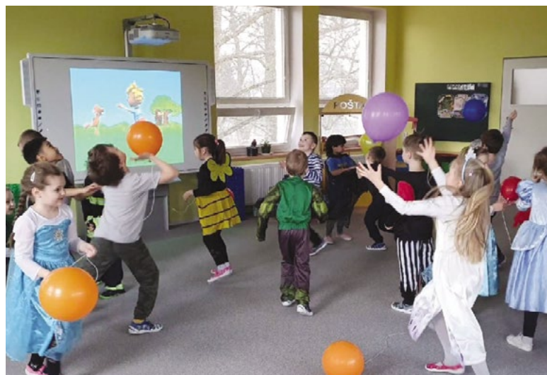
Masopust - Lvičata