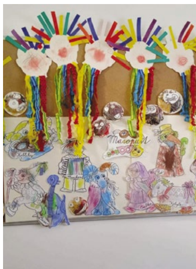
Masopust - nástěnka