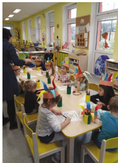
Masopust - Včeličky