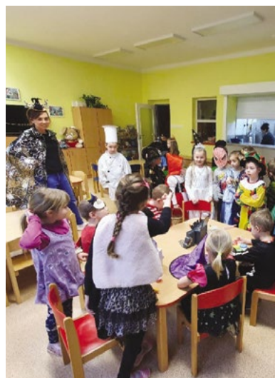
Masopust - průvod