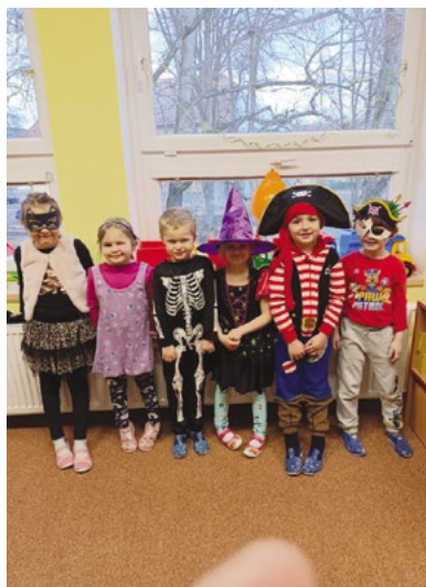
Masopust - Rybičky